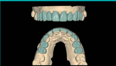
Diseño digital carillas.