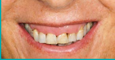
Sonrisa (planificación facial).