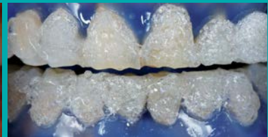
Blanqueamiento clínico y domiciliario.