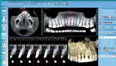
CBCT para planificación de alargamiento coronario.