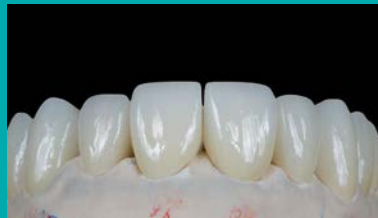
Carillas sobre modelo impreso.