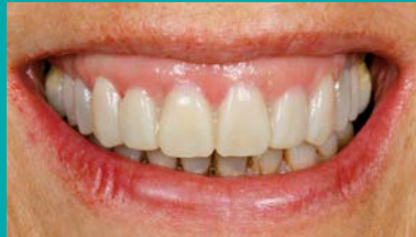
Prueba Mockup Digital.