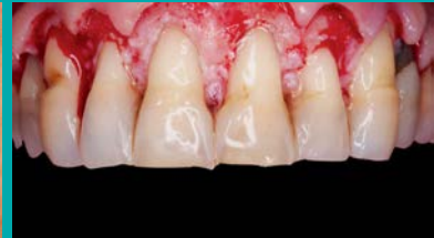
Alargamiento guiado con férula.