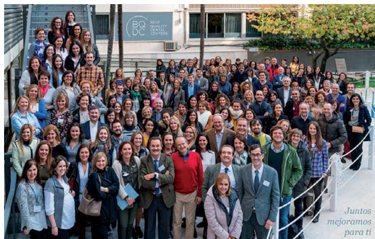
Juntos mejoramos para ti